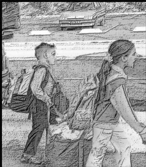
Des enfants traumatisés car leur camarade de classe ne viendra plus à l'école.