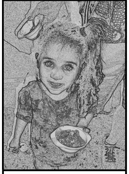
Des enfants mal hébergés, empêchés d'aller à l'école, privés de soins médicaux...