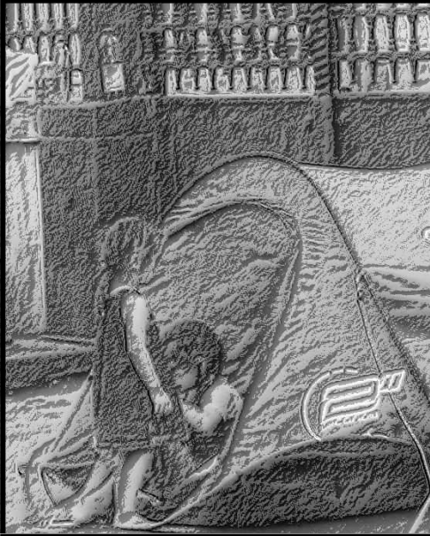
Des enfants jetés à la rue dorment dans des tentes.